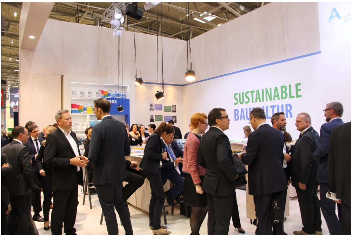
Abb. 2: Expo Real 2016 - BKI-im-Dialog - zum BIM-Handbuch